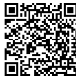
Wie Wirtschaft funktioniert