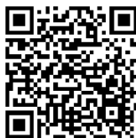
Wirtschaft heute derzeit vergriffen