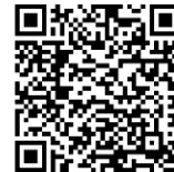
Geld und Geldpolitik